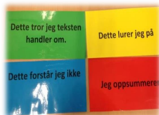
Bilde: Lesestrategier – rollekort

Lærer viser deretter noe fra teksten, f. eks. overskrifter, ingress, bilder og bildetekster, og i makkergruppene gjetter de innholdet og deler sine første inntrykk av hva denne teksten kan handle om. 1. rolle har ansvaret for at denne aktiviteten skjer i sin gruppe. Teksten deles ut og hver elev leser teksten stille, så langt som er avtalt, før makkergruppen jobber videre med forståelsen av innholdet. Hver rolle har ansvaret for at den respektive aktiviteten gjennomføres i sin gruppe.