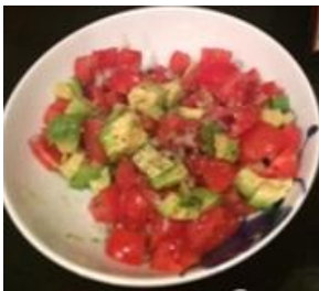
Tomater, avokado, tunfisk med olivenolje på toast