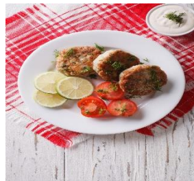
Fiskekaker eller fiskeburger