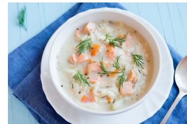
Fiskesuppe, reker og sellerirot og gulrot laget av lett matfløte