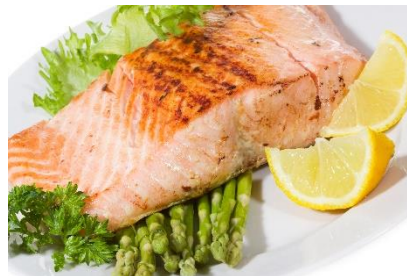
Laks, poteter, grønnsaker, yoghurt saus med dill