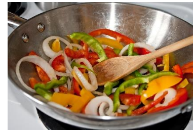
Wok grønnsaker med cashewnøtter og ris