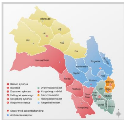
Figur 1. Vestre Vikens helseområde.